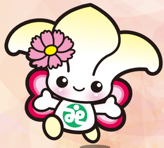
城東区社協 マスコットキャラクター「じょーたん」