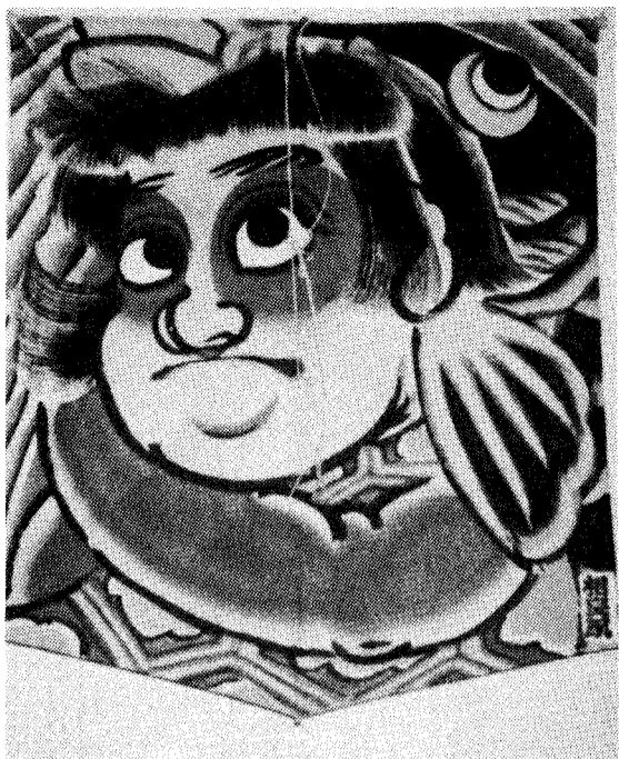
相良 颯 (静岡県・相良鯉金)